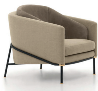
7 FIL NOIR FAUTEUIL CM 79X84 H75